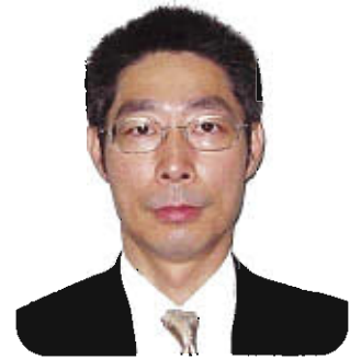
大分労働局雇用均等室長

微力ながら、より良い社会作りのためにも、少しでも皆様のお役に立てるよう努めてまいりたいと考えておりますので、今後ともよろしくお願い申し上げます。