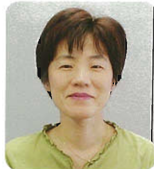
産業保健（基幹）相談員