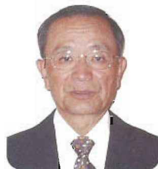
人分県南地域産業保健センター 前コーディネーター