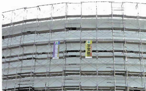
100,000KL原油タンク（直径83m、高さ20m） 側板塗装用全面仮設足場

安全衛生に関するその他の日常活動においては、他社事故事例の情報収集とその水平展開による類似事故の未然防止、ヒヤリハット事例の収集と事例の公開による事故の未然防止、労働安全衛生法や建設業労働災害防止規定等の法令に関する改正情報をインターネットを利用していち早く収集し、対応の検討を行なっています。又、夏場作業における熱中症予防対策、感電事故防止対策等についても他社や過去の事故事例の教訓を社員および協力会社様に教育、周知しています。