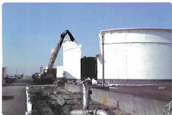
平成19年 扇島西地区（川崎市）タンク解体工事

しており、各現場での工事では事前に必ず『工事安全打合せ』を行ない、その打合せの中で、危険性又は有害性に関する作業について十分検討し作業手順の確認を行なっています。又、日々の作業開始時にはTBM（ツールボックスミーティング）を実施し、KY（危険予知）を行っています。KYの結果は、ボードに記入して現場に常時掲示し、作業員の危険に対する感度を上げるようにしています。