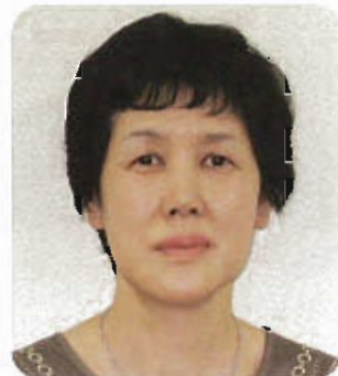
産業保健（基幹）相談員