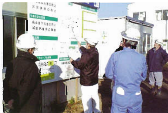
朝一番工事着手前「KY活動」

当社では、工事現場での安全を図るため安全担当者による安全パトロールを実施しています。パトロールにより、不安全行為の撲滅・作業環境の改善等を指導しています。また、危険予知（KY）の実施状況とその内容の確認・使用機器の始業点検の確認も実施し、事故の未然防止を図っています。安全パトロールは、九州石油株式会社大分製油所殿構内はもちろんのこと外部での工事についても実施しています。