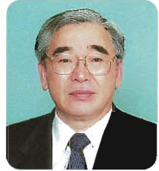
大分県歯科医師会 会長